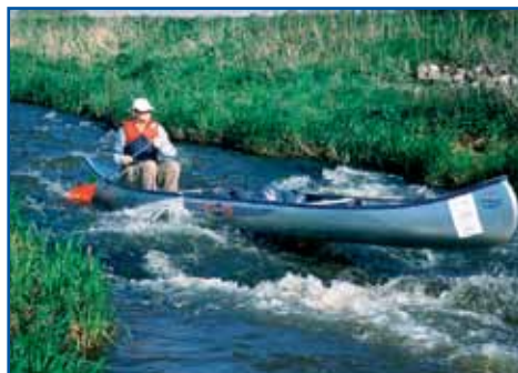
Kano gennem strygene

En sejltur ad Gelså byder på en meget varieret naturoplevelse, men den byder også på en udfordrende sejlads for den øvede kanoer. Over Kastrup Enge er åen snorlige og kanalagtig, mens vandløbet slynger sig naturligt og helt vidunderlig flot ved Stensbæk Plantage og ned for Aftægten i Enderupskov. Den omfattende regulering har også omfat-